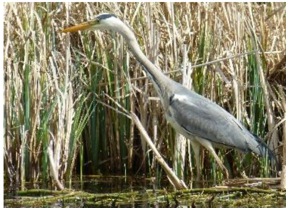
Blauwe reiger – Héron cendré

Dans la mare, les grenouilles se régaler d'insectes et sont elles-mêmes au menu du héron cendré. Le peuplage des marais et l'iris des marais, symbole de la Région de Bruxelles-Capitale, y fleurissent.