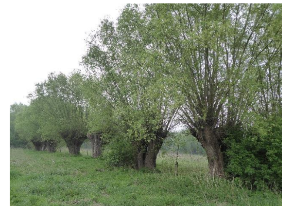
Sauls têtards - Knotwilgen

Rond de ruïne van de Mijlemeerschhoeve is het vroegere landschap van de Pajotse boerkozen goed bewaard. Naast en achter de hoeve liggen oude fruitboomgaarden die vroeger vooral bestonden uit kerselaars. Achter de boomgaard omzomen de indrukwekkende knotwilgenrijen het vroegere weiland. Eén van de knotwilgen staat op de Brusselse inventarislijst van natuurlijk erfgoed.