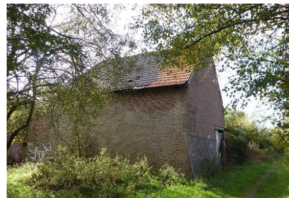
Mijlemeerschhoeve – Ferme du Meylemeersch

Autour des ruines de la ferme du Meylemeersch, l'ancien paysage agricole du Pajottenland a été bien conservé. Le long et à l'arrière de la ferme se trouvent d'anciens vergers qui étaient principalement composés de cerisiers. Derrière le verger, l'ancienne prairie est bordée d'impressionnantes rangées de saules têtards dont l'un figure à l'inventaire du patrimoine naturel de Bruxelles.