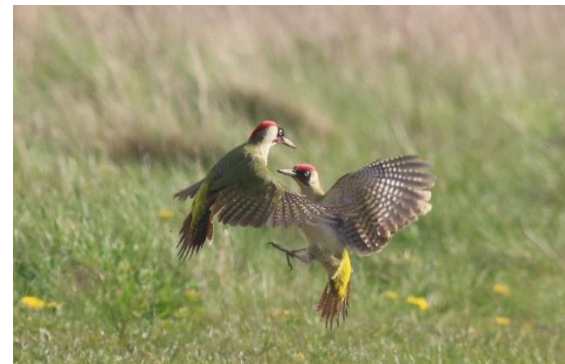
Pic vert – Groene specht

Dans la prairie poussent des plantes aux noms étranges, comme la campanule raiponce, la renouée persicaire, la vesce hérissée, la bugrane épineuse, etc. Les fleurs attirent toutes sortes d'insectes qui sont une source inépuisable d'observations pour les amoureux de la nature. Pendant la journée, les éperviers d'Europe, les faucons crécerelles et les buses variables y chassent. Au crépuscule et la nuit, ils sont relayés par les chouettes chevêches, les hulottes, les effraies des clochers et les mammifères volants que sont les chauves-souris.