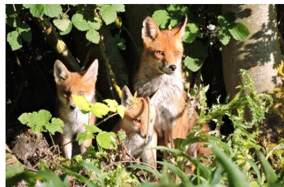
Famille vossen – Famille de Renards

Avec la disparition de l'agriculture, la forêt a repris sa place dans le paysage. De nombreux oiseaux y trouvent refuge : grives mauvis et litornes, chardonnerets élégants, geais des chênes, merles noirs, verdiers d'Europe etc., sans oublier, tout en haut des arbres, les nids de la colonie de corbeaux freux. Une famille de renards y trouve refuge mais se montre rarement.