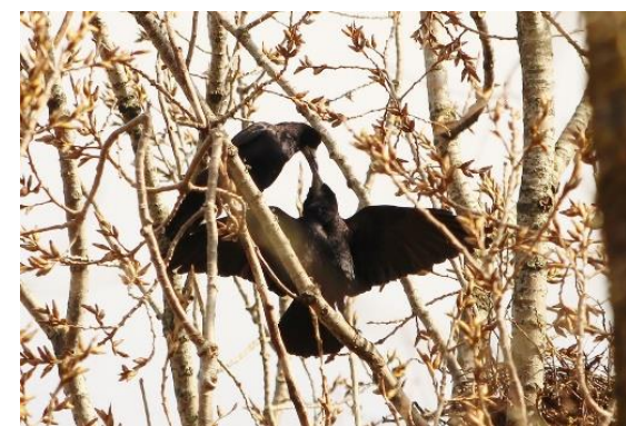
Colonie de Corbeaux freux – Roekenkolonie

Na de teloorgang van de landbouwactiviteit, heroverde het bos haar plaats in het landschap. Het beboste gebied sluit aan op het kerkhof van Anderlecht en het natuurreservaat van Vogelzang. Veel vogels vinden hier een onderkomen: koperwieken, putters, gaaien, merels, kramsvogels, groenlingen en hoog in de bomen bevinden zich de nesten van de roekenkolonie. Een familie vossen houden er zich schuil maar laat zich zelden zien.