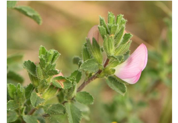
Bugrane épineuse - Kattendoorn

In het open grasland groeien planten met wonderlijke namen zoals het rapunzelklokje, perzikkruid, ringelwikke, kattendoorn. De bloemen trekken allerhande insecten aan die voor natuurliefhebbers een onuitputtelijke bron zijn van waarnemingen. Overdag jagen hier sperwers, torenvalken en buizerds. In de schemering en 's nachts worden ze afgelost door steenuilen, bosuilen, kerkuilen en vleermuizen.