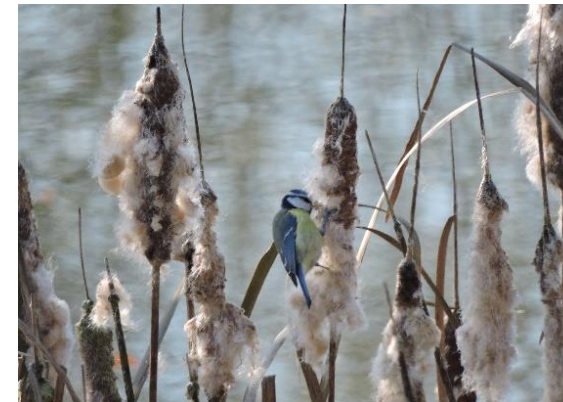
Mésange bleue - Pimpelmees

In de poel doen de kikkers zich te goed aan de insecten en staan zelf op het menu van de blauwe reiger. In het voorjaar bloeit er dotterbloem en gele lis, het embleem van het Brussels Hoofdstedelijk Gewest.