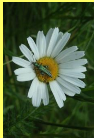
Leucanthemum vulgare & Oedemera nobilis ♂