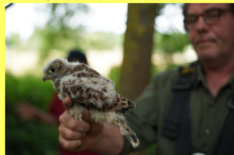
Falco tinnunculus

avec la participation de la Ligue Royale Belge pour la Protection des Oiseaux met deelname van de Koninklijke Belgische Liga voor de Bescherming van Vogels