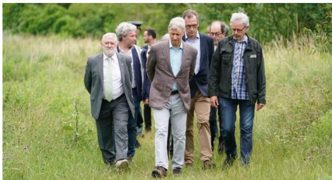
Visite du Roi – De koning op bezoek

Le Roi Philippe en visite dans la réserve naturelle Koning Filip op bezoek in het natuureservaat