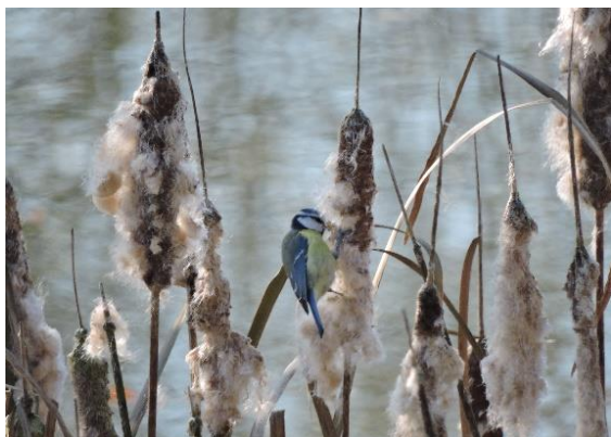
Mésange bleue - Pimpelmees

In de poel doen de kikkers zich te goed aan de insecten en staan zelf op het menu van de blauwe reiger. In het voorjaar bloeit er dotterbloem en gele lis, het embleem van het Brussels Hoofdstedelijk Gewest.