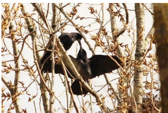
Colonie de Corbeaux freux – Roekenkolonie

Na de teloorgang van de landbouwactiviteit, heroverde het bos haar plaats in het landschap. Het beboste gebied sluit aan op het kerkhof van Anderlecht en het natuurreservaat van Vogelzang. Veel vogels vinden hier een onderkomen: koperwieken, putters, gaaïen, merels, kramsvogels, groenlingen en hoog in de bomen bevinden zich de nesten van de roekenkolonie. Een familie vossen houden er zich schuil maar laat zich zelden zien.