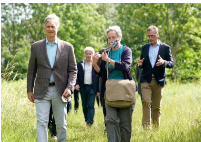
Visite du Roi – De Koning op bezoek

Nous espérons que la visite royale amplifiera nos actions de conservation de la biodiversité dans la vallée du Vogelzangbeek.