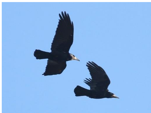
Corbeaux freux – Roeken

Compte tenu des problèmes liés au changement climatique et de l'augmentation prévue des espaces de bureaux vacants, il est incompréhensible que la Région bruxelloise continue à bétonner une nature précieuse.