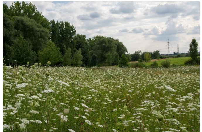
Meylemeersch– Mijlemeers

In dit zomernummer van de nieuwsbrief staat onze strijd voor het behoud van de biodiversiteit centraal. Alle knipperlichten staan op rood maar de betonmolens in het Brussels Gewest blijven verder draaien en Brussel verliest in ijtempo waardevolle open ruimte en natuur. Het roer moet worden omgegooid en we hopen dat de natuur in de Mijlemeers wordt gered.