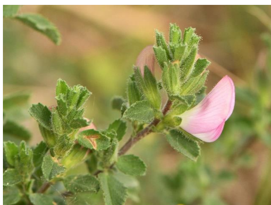
Bugrane épineuse - Kattendoorn

In het open grasland groeien planten met wonderlijke namen zoals het rapunzelklokje, perzikkruid, ringelwikke, kattendoorn. De bloemen trekken allerhande insecten aan die voor natuurliefhebbers een onuitputtelijke bron zijn van waarnemingen. Overdag jagen hier sperwers, torenvalken en buizerds. In de schemering en 's nachts worden ze afgelost door steenuilen, bosuilen, kerkuilen en vleermuizen.