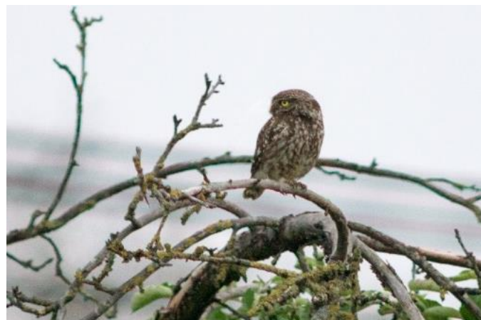
Chouette chevêche - Steenuil

Elke hectare extra beton zal de biodiversiteit van de ganse vallei verder onder druk zetten. De Mijlemeers is trouwens de laatste gekende broedplaats van de steenuil in het Brussels Gewest. We zijn niet van plan om de vernietiging van de Mijlemeers in stilte voorbij te laten gaan. Als symbool voor ons verzet hebben we de roek gekozen die er opvallend aanwezig is.