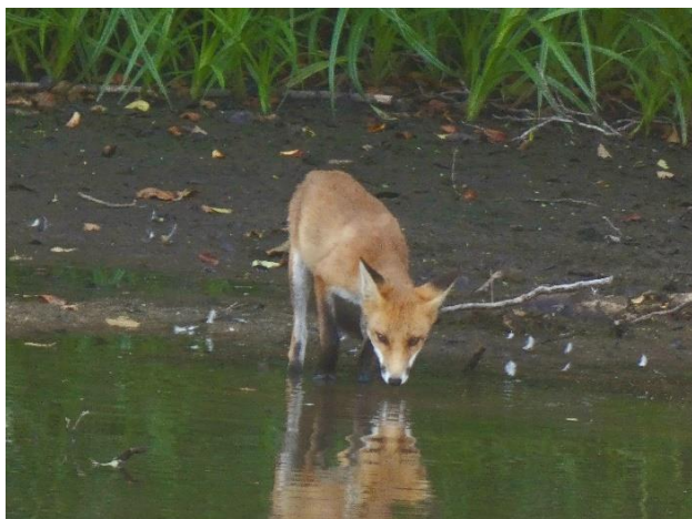
Renard – Vos

Op 10 maart 2022 was het eindelijk zo ver en keurde de Brusselse Regering de hernieuwing van het statuut van het erkend Natuurreservaat Vogelzangbeek goed, dat geldig is voor de komende 20 jaar. De hernieuwing ging gepaard met een uitbreiding van het reservaat van 13 naar 17 ha. De grootste eigenaar die terreinen ter beschikking stelt van het reservaat is de gemeente Anderlecht. Daarnaast is een deel van de terreinen eigendom van Bruxelles Formation, de Vlaamse Dienst voor Arbeidsbemiddeling en de firma SA Mechbal. De uitbreiding hebben we te danken aan de extra terreinen van de gemeente Anderlecht en van de SA Mechbal.