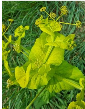
Maceron perfolié