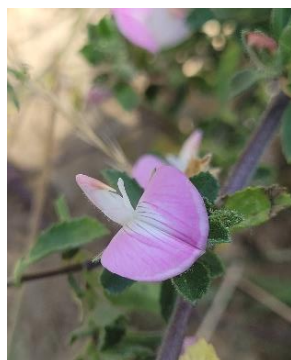
Bugrane rampante