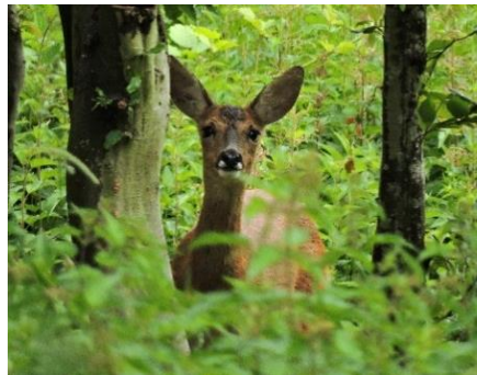
Chevreuil – Ree – 29/05/2022 Meylemeersch - Mijlemeers

PEUT-ON ENCORE SE PERMETTRE DE DETRUIRE UNE PARTIE DE LA BIODIVERSITE ?