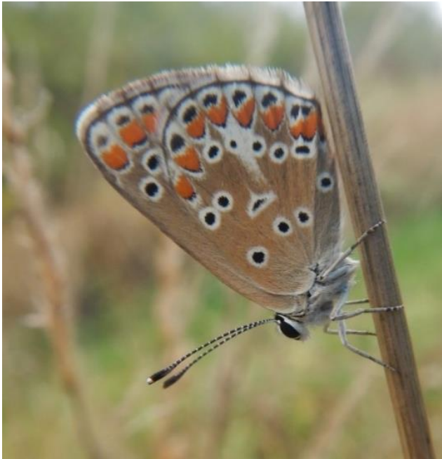
Aricia agestis (Collier de corail ou Argus brun) ♀

Ainsi, lors des deux visites guidées estivales (7 et 21 août), nous n'avons même pas eu l'occasion d'observer des espèces communes telles que le syrphe ceinturé ( Episyrphus balteatus ) ou des représentants de la famille des Satyrinés : le Myrtil ( Maniola jurtina ) et l'Amaryllis ( Pyronia tithonus ).