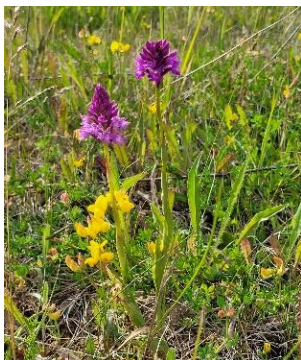
Orchis pyramidal