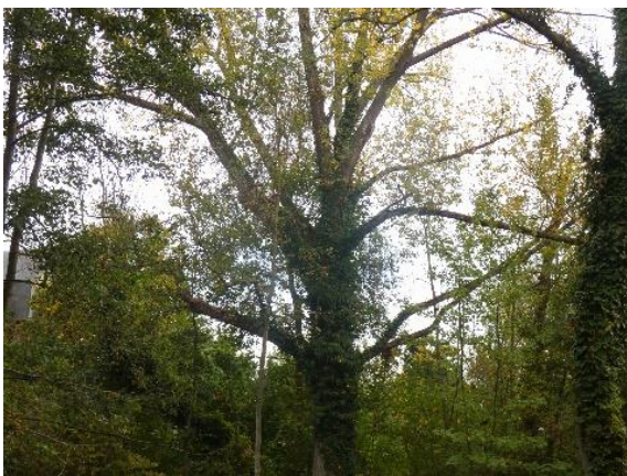
Populus x canadensis 'Serotina'

https://sites.heritage.brussels/fr/trees/7396