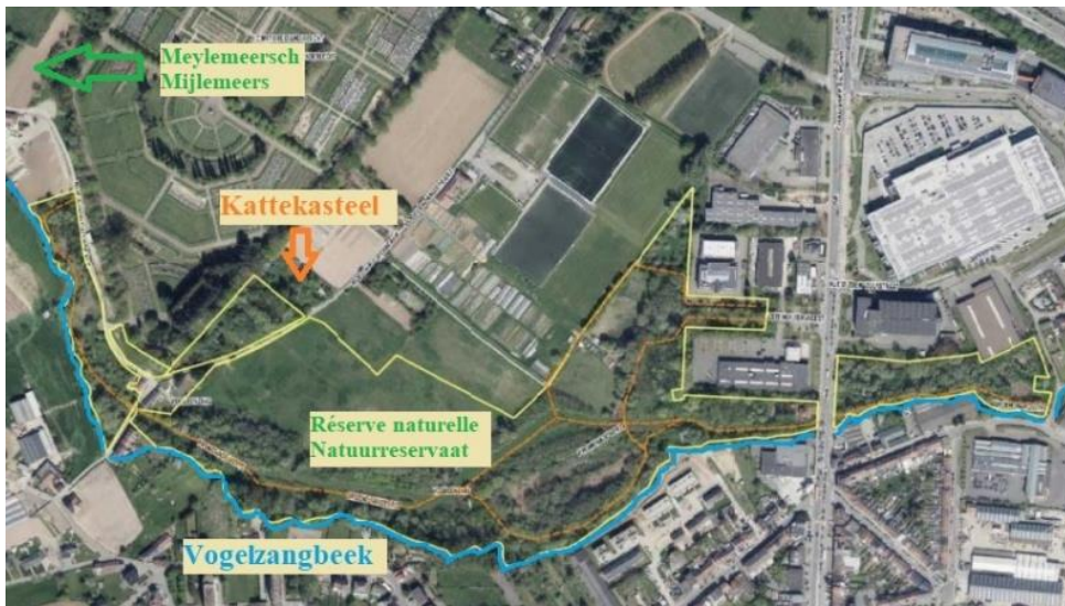
Périmètre Réserve Naturelle (jaune)

Le 10 mars 2022, le gouvernement bruxellois a finalement approuvé le renouvellement du statut de réserve naturelle agréée du Vogelzangbeek, statut valable pour les 20 prochaines années. Le renouvellement s'accompagne d'une extension du périmètre de 13 à 17 ha. Le plus grand propriétaire qui met des terrains à la disposition de la réserve est la commune d'Anderlecht. En outre, d'autres parties du terrain appartiennent à Bruxelles Formation, au Service Flamand de l'Emploi et à la firme SA Mechbal. Nous devons cette expansion aux terrains supplémentaires appartenant à la commune d'Anderlecht et à la SA Mechbal.