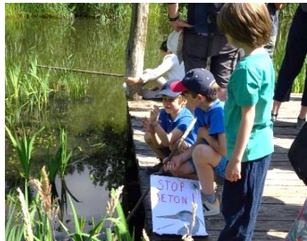
STOP BETON - 12/06/2022

Faites connaissance avec le Meylemeersch via La Minute Sauvage (p. 6)