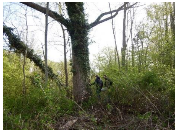
Populus x canadensis 'Serotina'

https://sites.heritage.brussels/fr/trees/7396