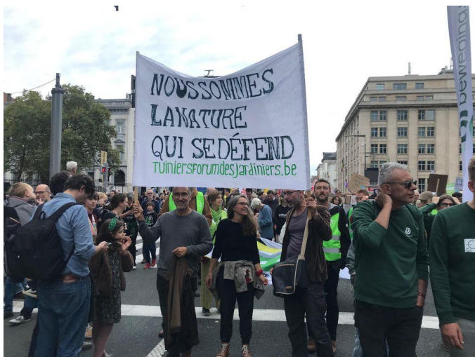
23-10-2022, Tuiniersforum des Jardiniers Klimaatmars – Marche pour le climat

Partout dans le monde, on tire la sonnette d'alarme ! Les effets négatifs du changement climatique et du déclin de la biodiversité font des victimes et menacent de rendre le monde invivable. Pendant ce temps, en Région bruxelloise, les derniers morceaux de nature de valeur disparaissent sous le béton et des centaines de vieux arbres sont condamnés.