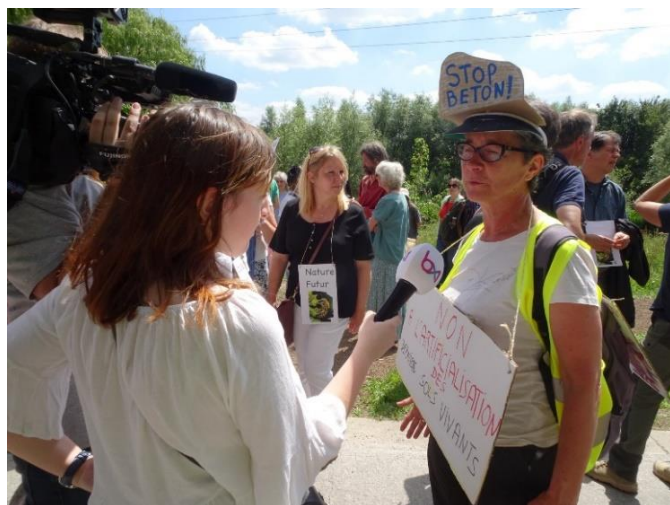
12/06/22 - Red de Mijlemeers – Sauvons le Meylemeersch

Op zondag 12 juni, organiseerde CCN Vogelzang CBN samen met het Tuiniersforum des Jardiniers een mars in de Mijlemeers. De grote opkomst toont aan dat mensen de vernietiging van onze natuur meer dan beu zijn. Een duidelijk signaal naar Citydev, Regie der Gebouwen en ULB om hun bouwplannen te stoppen en een waarschuwing dat de natuur niet dient om tijdelijke kampen op te richten voor Oekraïense vluchtelingen.