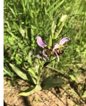
Ophrys abeille-Bijenorchis