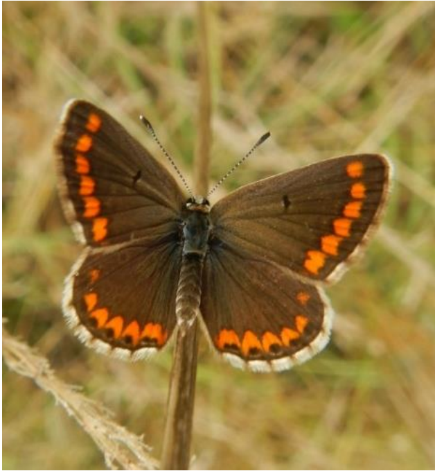
Aricia agestis (Collier de corail ou Argus brun) ♀

Et pourtant, au cours de l'une de ces deux visites, nous avons observé sur l'Epilobe hirsute ( Epilobium hirsutum ) trois très belles et imposantes chenilles du Grand Sphinx de la vigne ( Deilephila elpenor ). Si vous souhaitez en savoir plus sur ce papillon nocturne, voici un lien internet :