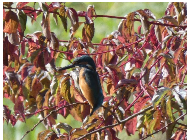
Martin-pêcheur – Ijsvogel

De nieuwe beheerder is de LRBPO, de Franstalige Vogelbescherming, terwijl op het terrein CCN Vogelzang CBN de werkzaamheden blijft uitvoeren. Door onze samenwerking met een grotere organisatie zorgen we voor een grotere zekerheid in de continuïteit van het beheer tijdens de komende jaren.