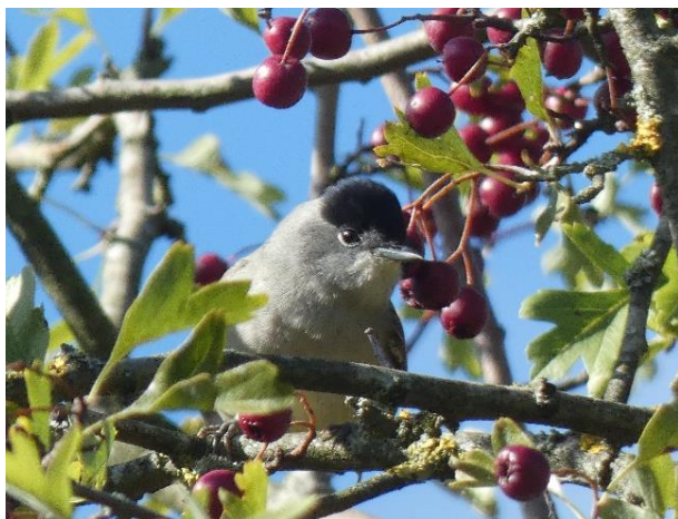
Fauvette à tête noire – Zwartkop

Le Mijlemeers se caractérise par une alternance de zones boisées, d'espaces ouverts et d'eau et peut donc charmer de nombreuses espèces différentes telles que les chevreuils qui y sont régulièrement observés. De manière impressionnante, le faucon pèlerin vient également y chasser. Ce rapace de taille moyenne est connu pour être le plus rapide du monde (390 km/h en piqué). Vous pourrez y apercevoir la belle fauvette à tête noire, un oiseau chanteur qui se nourrit d'insectes, de larves, d'araignées et de baies.