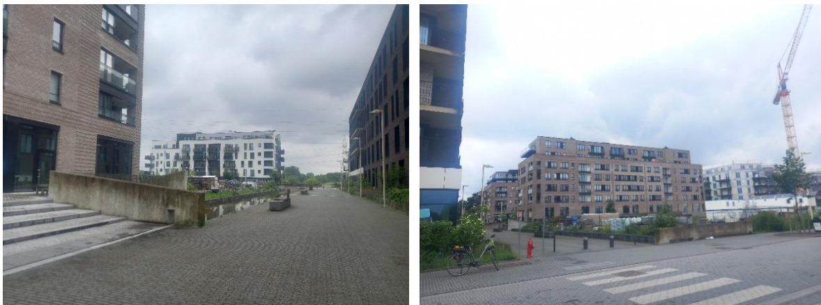
Ceci n'est pas un écoquartier

Het resultaat dat we vandaag zien staat ver af van de oorspronkelijke doelstellingen. Veel beton - de openbare ruimte is bijna volledig verhard, er zijn lege commerciële ruimten, vrijwel geen gemeenschapsvoorzieningen, een betonnen kanaal en kunstmatig groen dat geen waarde heeft in termen van biodiversiteit.